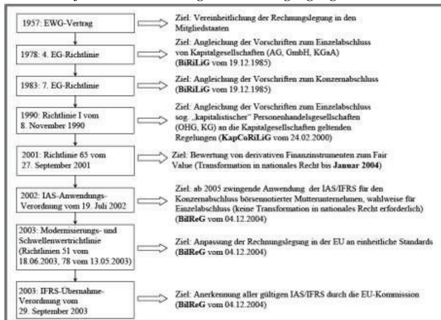
Abb.1. Verlauf der Harmonisierung der Rechnungslegung in der EU und EWG